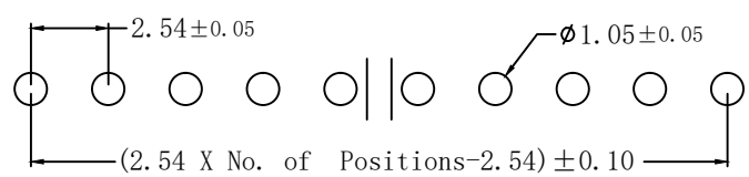
Recommended PCB Layout

接触材料 (Contact Material): 黄铜(Brass) 塑胶材料 (Insulator Material): 尼龙(Nylon)-9T, UL 94V-0; 颜色: 黑色 接触电镀 (Contact Plating): 镀金 (Gold plated) (电镀规格可根据客户要求来定制) Opitonal planting on request.