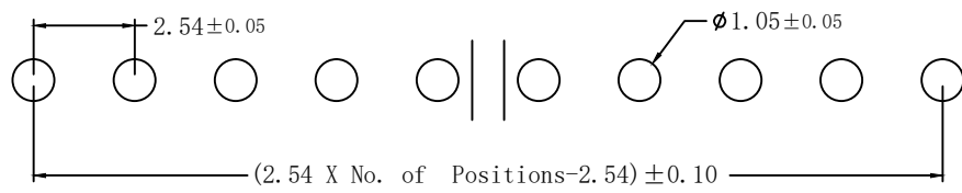
Recommended PCB Layout

弯曲度: 1*02P ~ 1*20P 0.30 MAX. 1*21P ~ 1*30P 0.40 MAX. 1*31P ~ 1*40P 0.50 MAX.